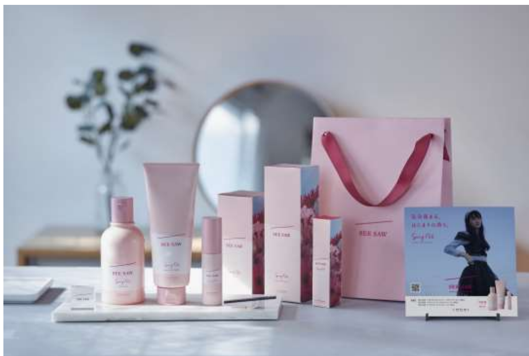
左:SEE/SAW ヘア&スカルプシャンプー スプリングノート 21 250mL 中:SEE/SAW ヘアトリートメント スプリングノート 21 200mL 右:SEE/SAW クリアオイル スプリングノート 21 30mL

「美しい人生を、かなえよう。」をパーパスに理美容や医療の業務用設備機器および化粧品などを製造・販売するタカラベルモント株式会社(本社:大阪市中央区、代表取締役会長 兼 社長:吉川 秀隆)は、理美容室専売の化粧品ブランド「LebeL」から展開中のヘアケアシリーズ「SEE/SAW」より、艶をきれいに魅せるシャンプー・ヘアトリートメント・クリアオイル「Spring Note 21」(数量限定)を2月20日に発売いたします。