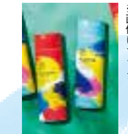
※画像はイメージ プレイング 21シャンプー/200ml、プレイング 21トリートメント/200ml各1,980円(税込) 2021.4 DEBUT

「#アクティブ女子」がターゲットの、夏のシャンプー&トリートメント「PLAYING」。2020年に登場したこのアイテムの、2021夏限定版がこの4月に登場! 夏のストレスによる<紫外線ストレスケア>、<皮脂ストレスケア>、<気温ストレスケア>ができるすぐれもの。#アクティブ美容師&#アクティブ女子のお客さまにおすすめです。