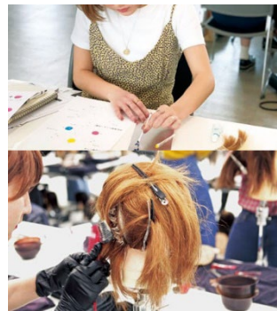
〈スタジオ講習 イメージ〉