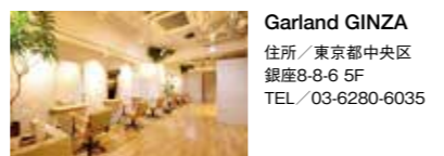
Garland GINZA 住所/東京都中央区 銀座8-8-6 5F TEL/03-6280-6035