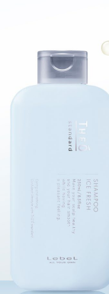
SHAMPOO ICE FRESH